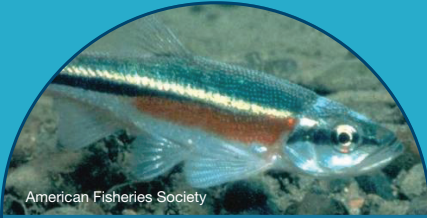
American Fisheries Society