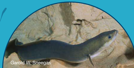
Garold W. Sneegas